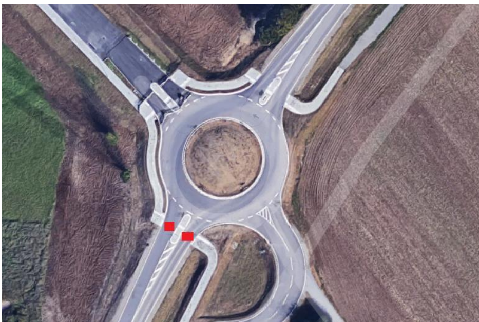
Der Kreisel aus der Vogelperspektive. Auf den rot markierten Flächen soll ein Zebrastreifen entstehen.