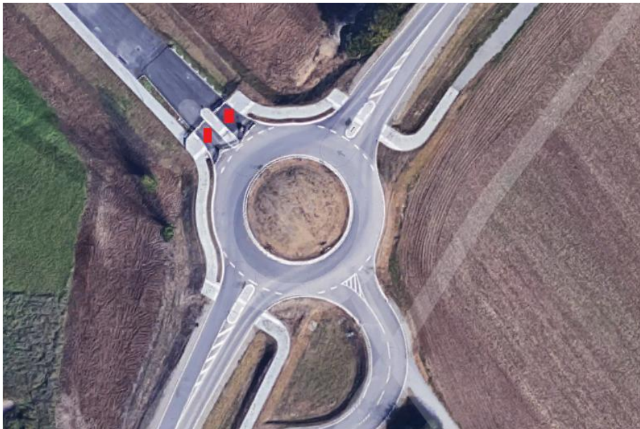
Der Kreisel aus der Vogelperspektive. Auf den rot markierten Flächen soll ein Zebrastreifen entstehen.